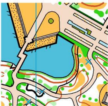
「柏の葉公園」地図サンプル

ここにはサッカーJ2チームの柏レイソルのホームスタジアム・「柏の葉スタジアム」があります。